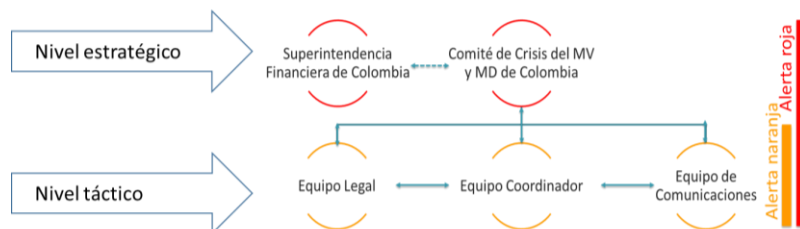
Gráfico 1 - Estructura de Gobierno

En los órganos de gobierno participan los funcionarios designados por cada uno de los proveedores de infraestructura que son parte de este Protocolo. Según lo estimen necesario o conveniente, los órganos de gobierno del Protocolo podrán invitar a personas externas, asesores, o representantes de terceros, incluyendo los MAPs.